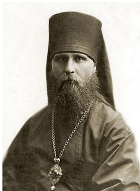
Священномученик Иларион (Троицкий)

лили характер и усовершенствовали добрые качества его души. «Любовь его ко всякому человеку, внимание и интерес к каждому, общительность были просто поразительными, — вспоминал соузник Владыки по лагерю, — Он доступен всем, он такой же, как и все, с ним легко всем быть, встречаться и разговаривать».