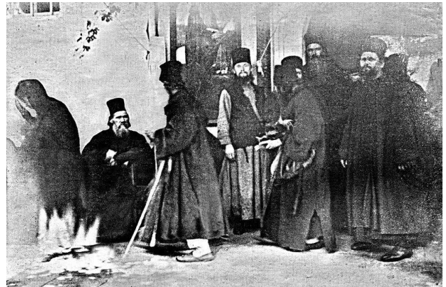
Чудо явления Божией Матери. 3 сентября (21 августа ст. ст.) 1903 г. Фотография