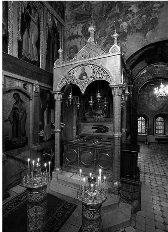
Рака с мощами преподобного Саввы

Для росписи этих храмов, построенных в так называемом раннемосковском (а правильное его ныне следует называть звенигородским) стиле, после 1395 года в Звенигород был приглашен молодой иконописец Андрей Рублев. По благословению Саввы он создал уникальный Звенигородский чин, часть которого была найдена случайно в 1918–1919 годах на Городке, включая знаменитого «Спаса Звенигородского» («Русского Спаса», ныне хранится в Третьяковской галерее). Предположительно старец Савва мог благословить преподобного Андрея Рублева на создание знаменитой иконы «Троица» для Троицкого собора в Троице-Сергиевой лавре (ныне в Третьяковке), построенном при прямом попечительстве князя Юрия Дмитриевича. Таким образом преподобный Савва сыграл важную роль в судьбе иконописца и духовно окормлял его в ранний период его творческого становления в течение нескольких лет. Покровительствовал также преподобному Андрею Рублеву и духовный сын святого Саввы князь Юрий.